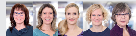
Das Team des Sozial- dienstes